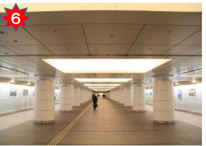
行幸地下通路を真っ直ぐ前進