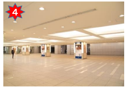
広い地下空間に出るので、左前方へ