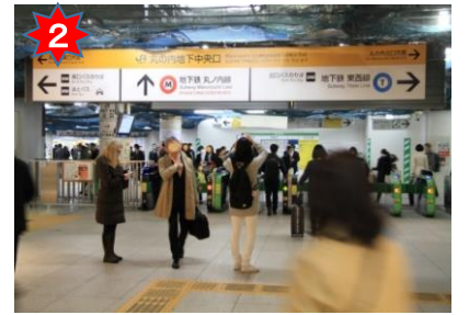
JR丸の内地下中央改札