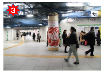
改札を出て、左前方の通路を進む