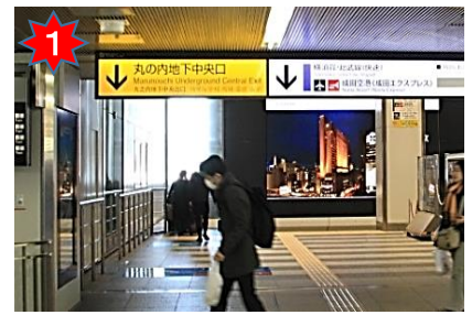
中央通路から丸の内地下中央口への階段を下りる