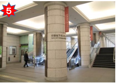
行幸地下ギャラリー入口のエスカレータを上る