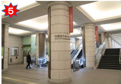
行幸地下ギャラリー入口のエスカレータを上る