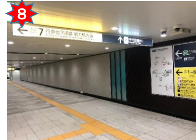
案内に従い通路を真っ直ぐ前進