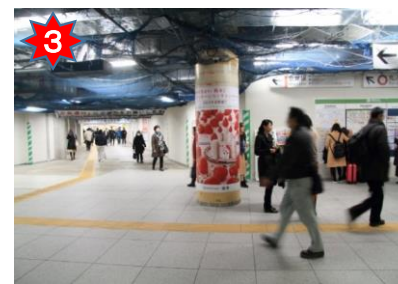
改札を出て、左前方の通路を進む