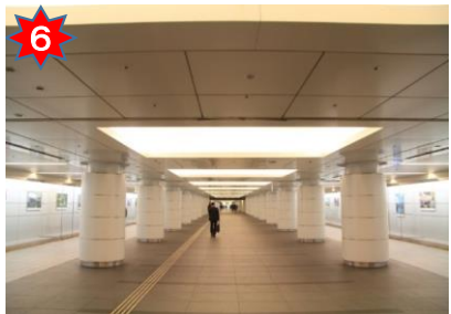
行幸地下通路を真っ直ぐ前進