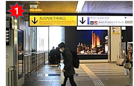
中央通路から丸の内地下中央口への階段を下りる