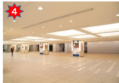
広い地下空間に出るので、左前方へ