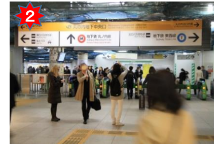
JR丸の内地下中央改札